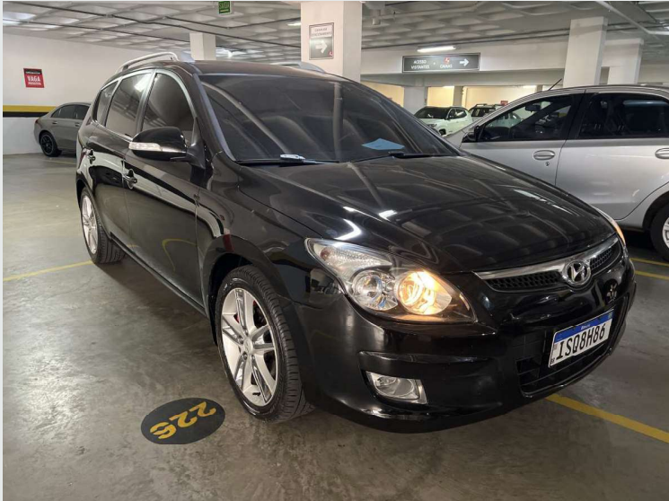
Diagonal dianteira passageiro