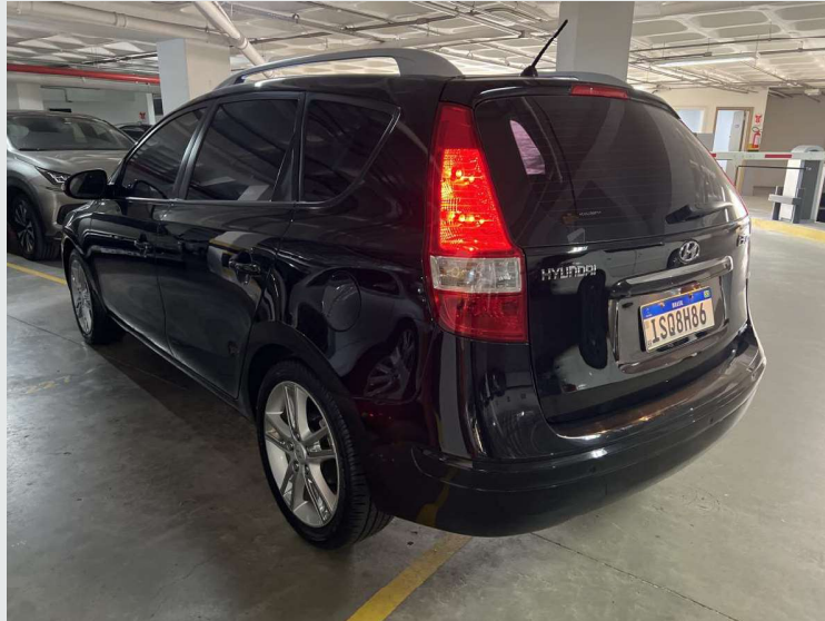
Diagonal traseira motorista